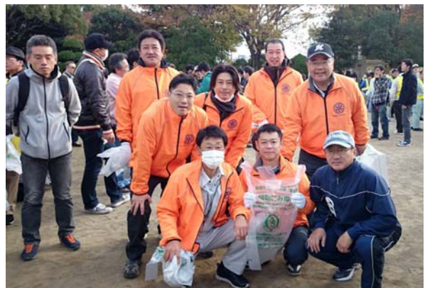
船橋をきれいにする日 (11月16日(日))